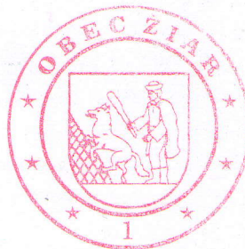
Okrúhla pečiatka obce